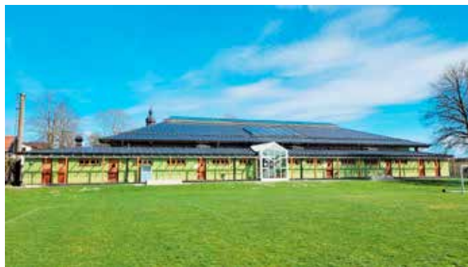
Foto: Die bisherige Ölheizung in der Eiselfinger Gemeindefeuerwehrhalle wird im Laufe dieses Jahres an das neue Nahwärmenetz angeschlossen.

Die zentrale Investition der Gemeinde Eiselfing konzentriert sich im laufenden Jahr auf den Anschluss ihrer Gebäude an das neue Nahwärmenetz in Eiselfing (rund 750.000 Euro nach Abzug einer Bundesförderung). Hinzu kom-