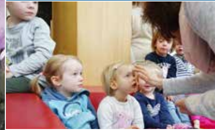
Neues aus dem Kindergarten