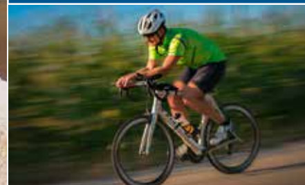
TSV Eiselfing: Die RAD-Saison beginnt