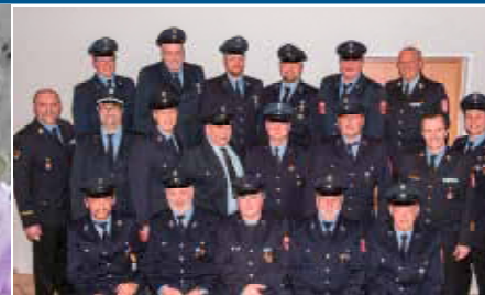
Jahreshauptversammlung der FF Aham