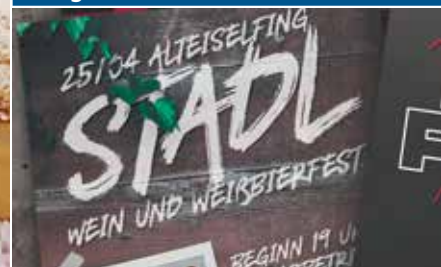
Vorankündigung Alteiselfinger Veranstaltungen