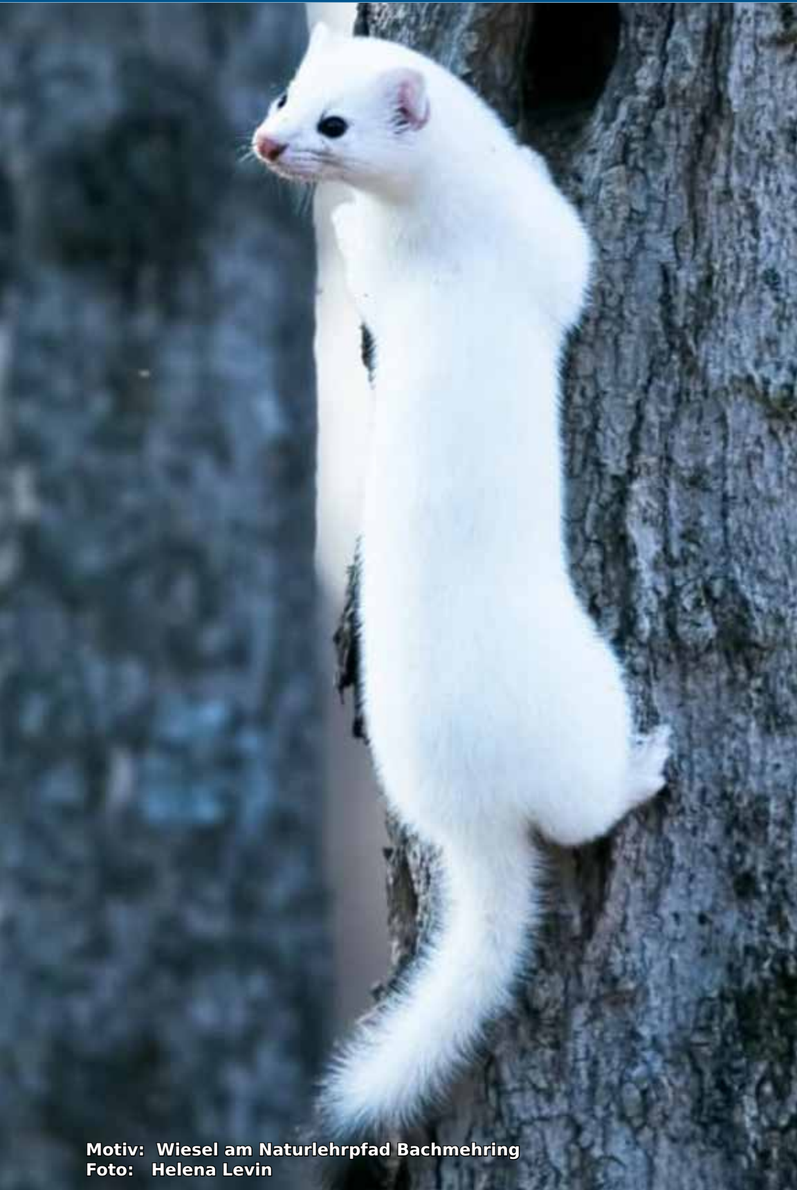
Motiv: Wiesel am Naturlehrpfad Bachmehring