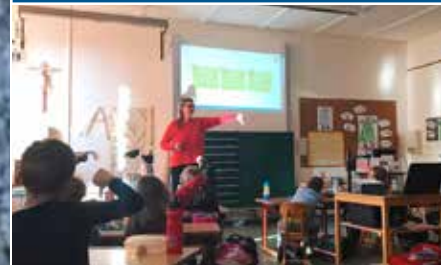
Aktuelles aus der Eiselfinger Grund- und Mittelschule