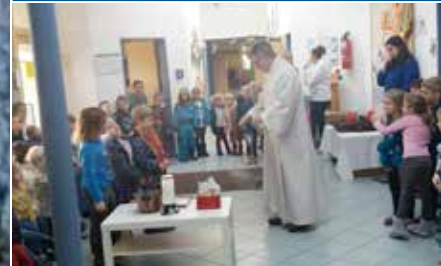
Nachrichten aus dem Kindergarten