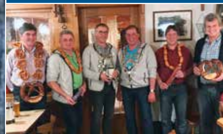
Königsschießen in Kerschdorf