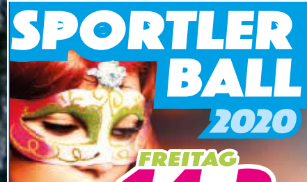
Eiselfinger Sportlerball am Freitag, 14. Februar