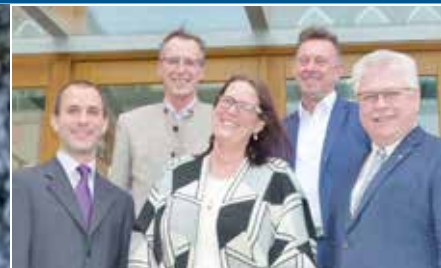
Eiselfinger Schule mit Defibrillator ausgestattet