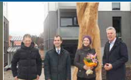
Holzskulptur im Eiselfinger Baugebiet enthüllt