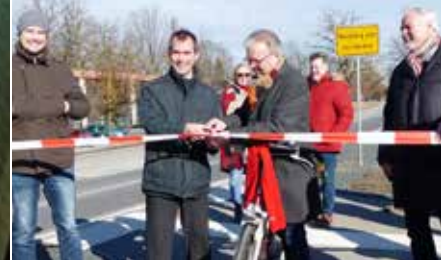
Radweg zwischen Eiselfing und Wasserburg eröffnet