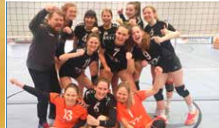
TSV Volleyball: Chance auf Dreifachaufstieg