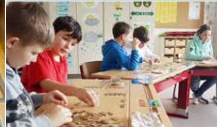
Aktion „Cent für Cent“ mit Rekordergebnis