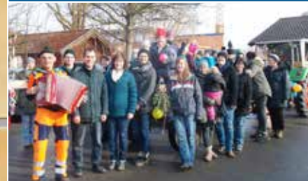
Kindergarten: Firstbaum gestohlen und ausgelöst