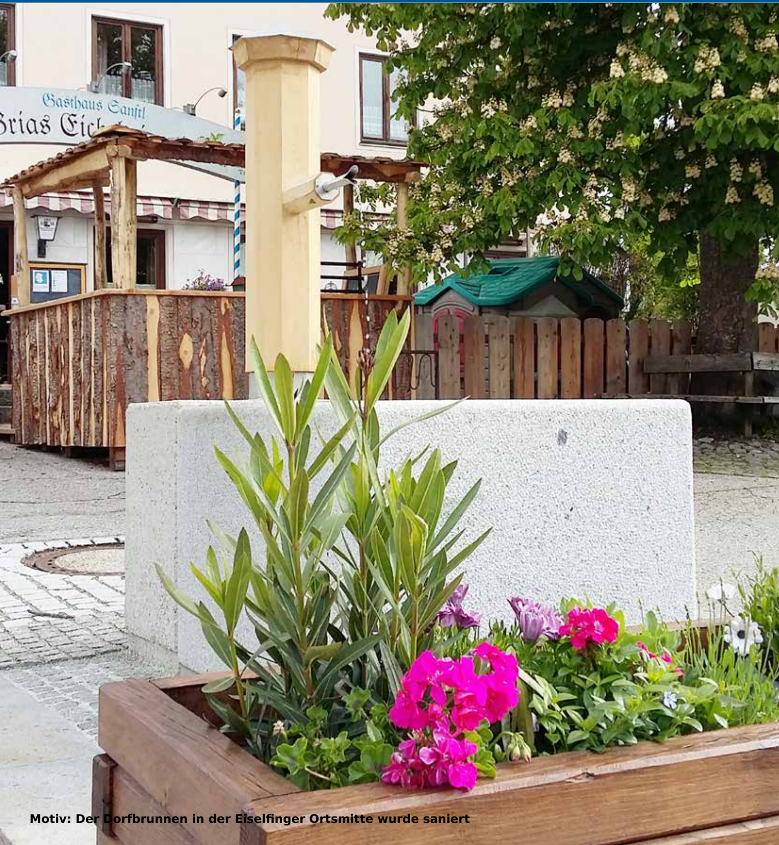
Motiv: Der Dorfbrunnen in der Eiselfinger Ortsmitte wurde saniert