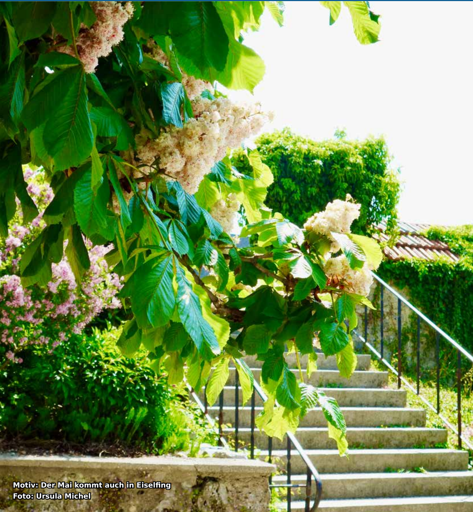
Motiv: Der Mai kommt auch in Eiselfing