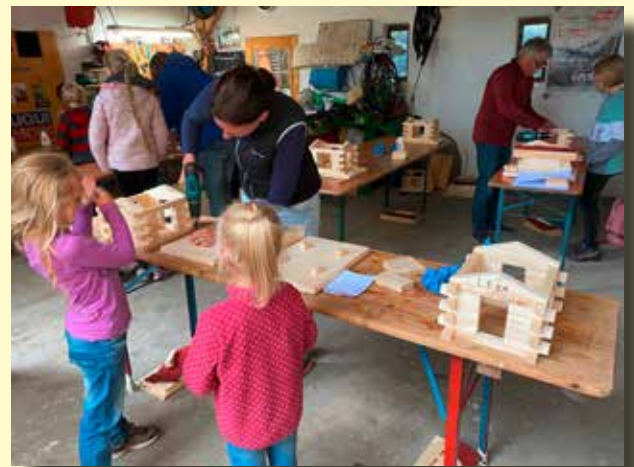
Wir bauen ein Vogelfutterhaus