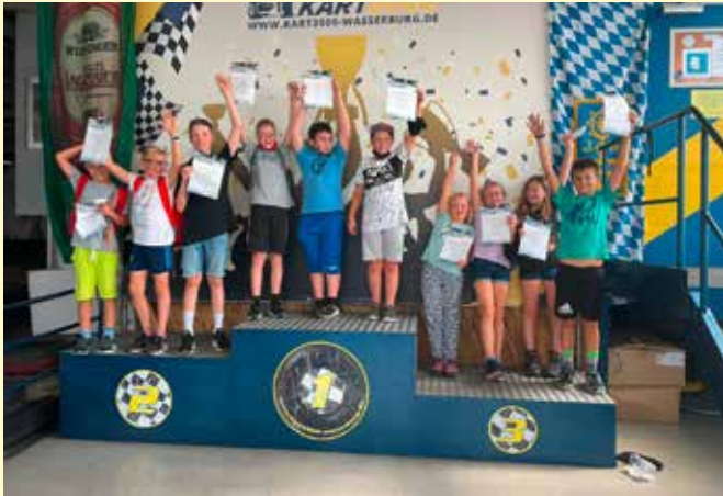
Kartfahren in Hafenham