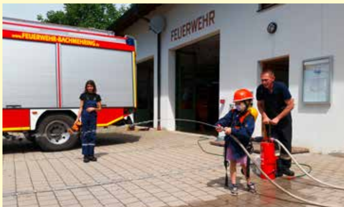
Ein Tag bei der Feuerwehr Bachmehring

Wir bedanken uns ganz herzlich bei unseren treuen Sponsoren für die großzügigen Spenden!