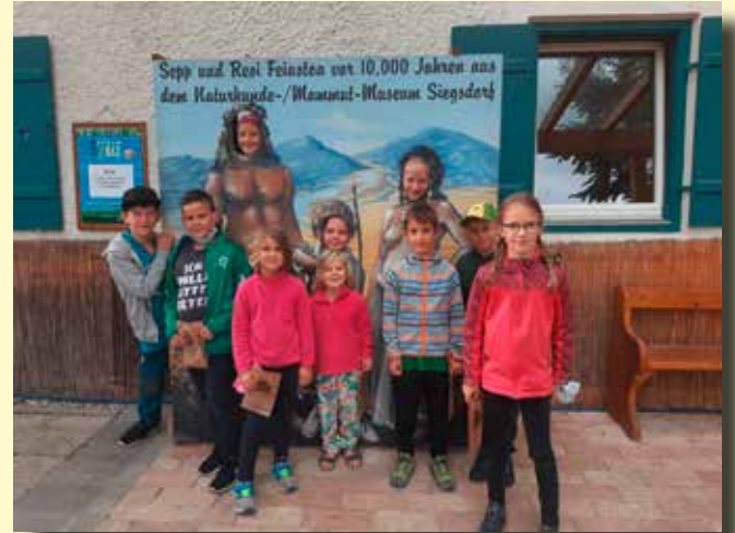
Besuch im Naturkunde- und Mammutmuseum Siegsdorf