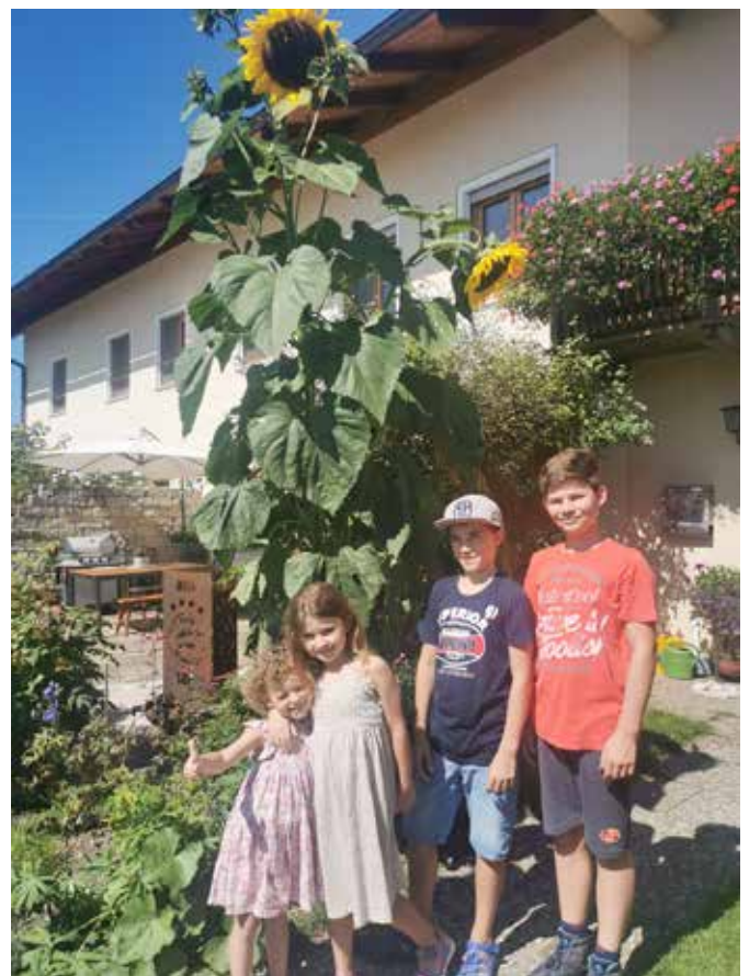
Überdimensionale Sonnenblume bei der Familie Löw in Berg