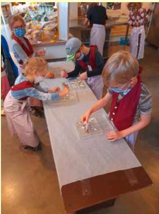
Das Geheimnis der Schokoladenherstellung