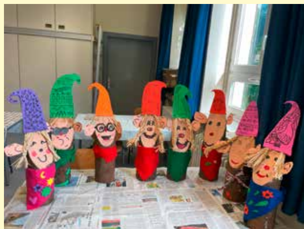
Wichtelbasteln beim Gartenbauverein