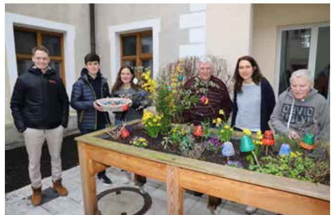
Foto: Vertreter der Mittelschule Eiselfing bei der Übergabe an die Stiftung Attl.