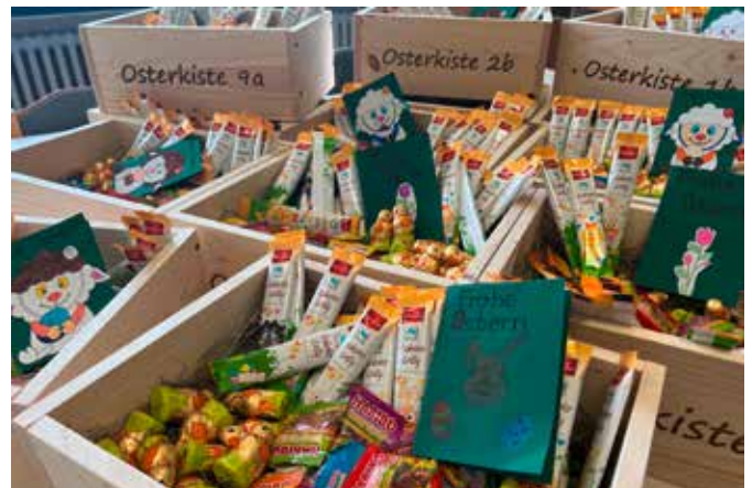
Foto: Die selbstgemachten Osterkisten.