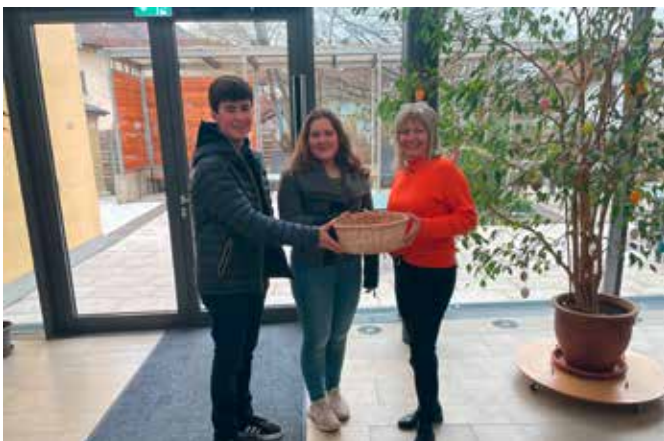
Foto: Das Duo der der neunten Klasse bei der Übergabe an das Betreuungszentrum Wasserburg bei Krohn-Leitmannstetter.