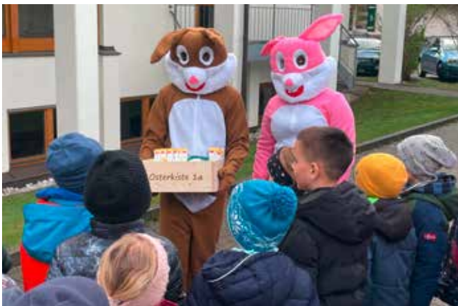
Foto: Das Osterhasenpärchen in Aktion.

letztes Jahr individuell gestaltet hatten, im ganzen Schulhaus versteckt und mussten im Team ausfindig gemacht werden. Das Osterhasenpärchen verfolgte das Treiben der Kinder gespannt aus nächster Nähe und konnte sich bestimmt die ein oder andere Idee für ein besonders gutes Versteck dabei anschauen. Wie auch im letzten Jahr ist in den ruhigen Feiertagen eines nicht zu vergessen – Nächstenliebe als Kern unserer Gesellschaft. Daher wurden von einigen Klassen der Mittelschule weiße Deko-Eier kreativ bemalt und gestaltet. Diese wurden von zwei Schülern der 9. Klasse an das Betreuungszentrum Wasserburg, Krohn-Leitmannstetter, und die Wohngruppe der Stiftung Attl in Eiselfing überreicht und man zeigte einmal mehr, dass sich in Eiselfing was mit ganz viel Herz und Verstand rührt.