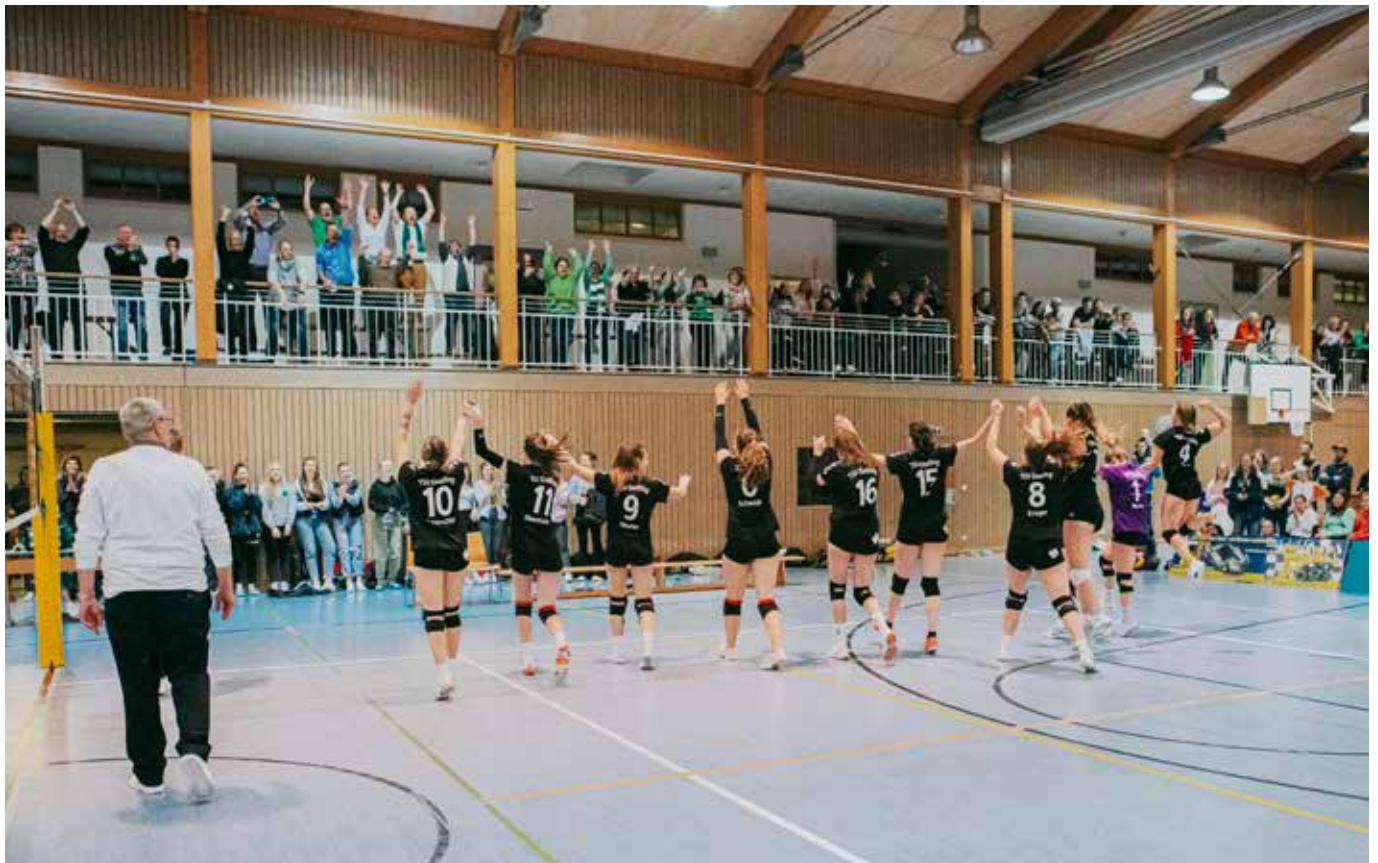
Jubel im Eiselfinger Hexenkessel