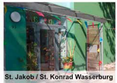
St. Jakob / St. Konrad Wasserburg

Vier Jahre nach seiner Gründung kann der KiTa-Verbund Wasserburger Land auf eine äußerst positive Entwicklung zurückblicken. Was 2021 als Zusammenschluss von vier Einrichtungen unter der Trägerschaft der Kirchenstiftung Sankt Rupert Amerang begann, hat sich zu einem gut vernetzten KiTa-Träger und regional beliebtem Arbeitgeber entwickelt.