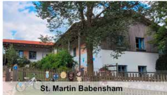
St. Martin Babensham