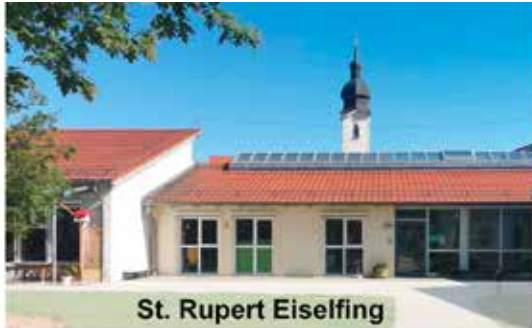
St. Rupert Eiselfing