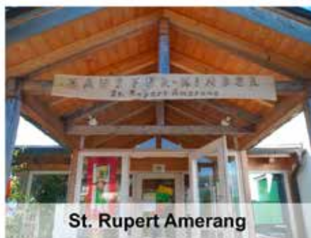
St. Rupert Amerang