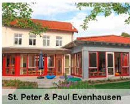
St. Peter & Paul Evenhausen