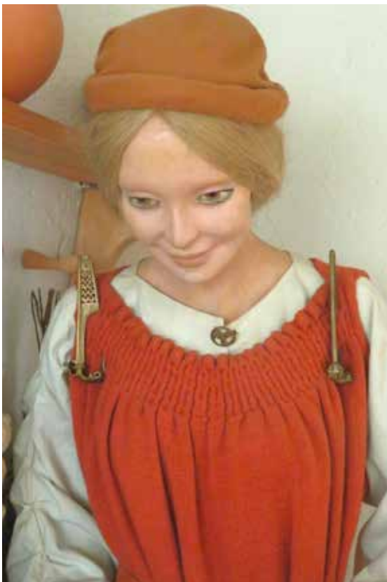
Figurine in norisch-pannonischer Tracht

Die kleine Kniefibel, gefunden 2023, wird in das 2./3. Jahrhundert n. Chr. datiert, während die 2025 geborgene Doppelknopffibel in das 1./2. Jahrhundert n. Chr. gehört. Sie ist ein typisches Detail der norisch-pannonischen Frauentracht und wird oft zusammen mit einem Paar Flügelfibeln