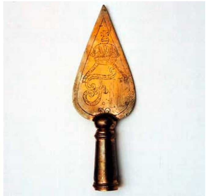
Standartenspitze mit dem Monogramm des Kaisers Franz Joseph II. im Museum Wasserburg.

Wie ein Feldlager zu jener Zeit ausgesehen hat, zeigt eine Votivtafel in der kleinen Wallfahrtskirche Kleinholzen, Gemeinde Stephanskirchen. Die Mannschaftszelte sind ordentlich nebeneinander aufgereiht. Bei einer Zahl von 10.000 Soldaten müsste es ein gewaltiges Zeltlager gewesen