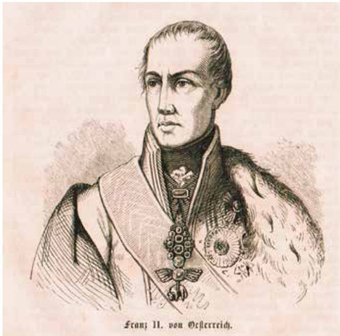
Kaiser Franz Joseph II.

Als Bayern und Österreich in den Kriegen gegen Napoleon kämpften, lagerten während der Sommermonate 1800 auf den Fluren der heutigen Gemeinde Eiselfing österreichische Soldaten aller Waffengattungen, die Kaiser Franz Joseph II. mit seinem Generalstab mehrfach inspizierte. Sowohl die Orts- als auch die Zahlenangaben variieren. Am 8. Juli waren 10.000 Mann angekommen und sollen zwischen Dirneck und Neudeck gelagert haben, wobei die Lokalität nicht näher angegeben wurde. Nach einem